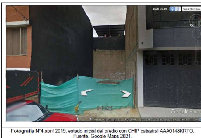
Fotografía N°4.abril 2019, estado inicial del predio con CHIP catastral AAA0148KRT0.

De acuerdo con la temporalidad del predio con chip catastral AAA0148KRSK, se logra identificar que en el mes de abril de 2019 se realizaban actividades constructivas de unidad habitación la cual constaba de tres pisos, ( fotografía N°4 ).