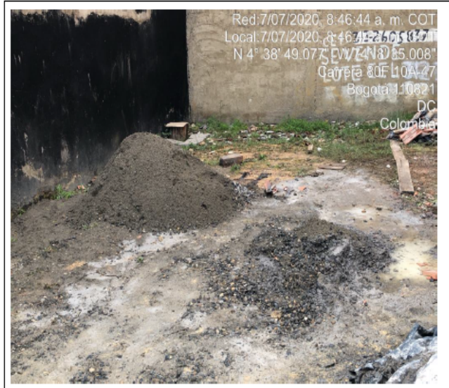
Fotografía No. 2. Mezcla de cemento en Predio con CHIP AAA0148KRTO.