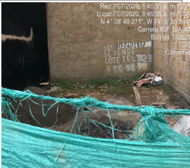
Fotografía No. 1. Acopio de materiales de construcción en predio con CHIP AAA0148KRTO.